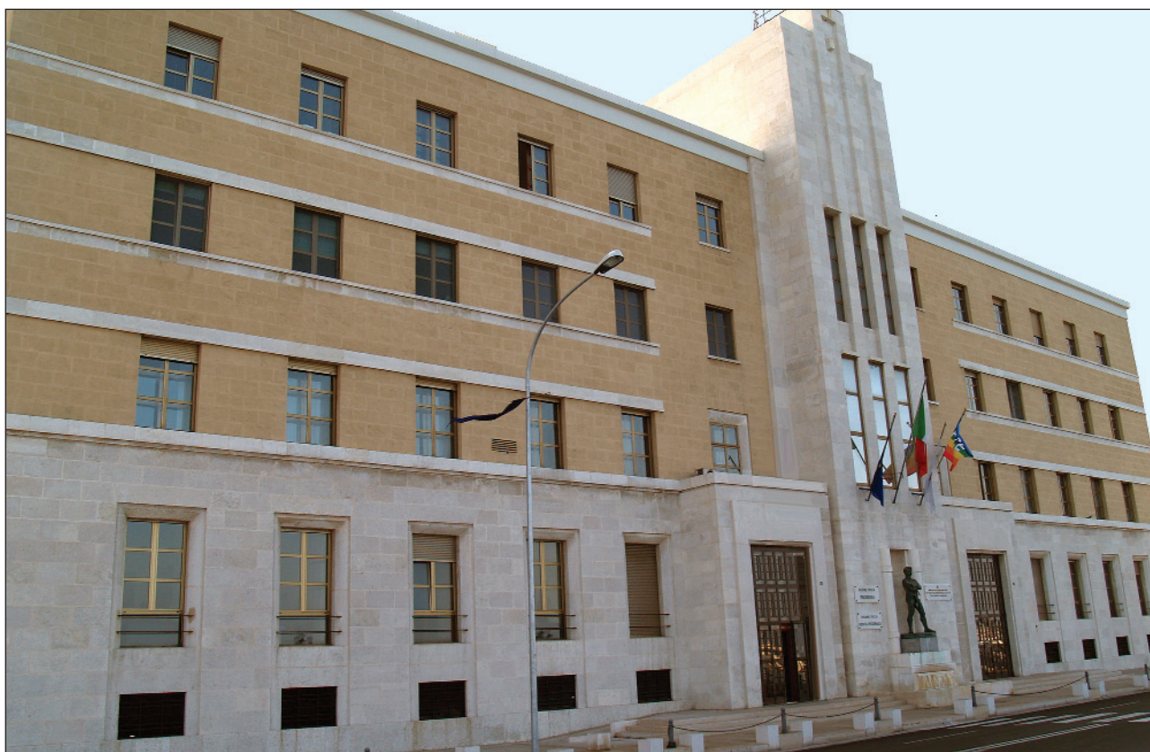
Sede Presidenza Giunta Regionale

Disegni di leggi regionali ai sensi e per gli effetti dell'art. 8 L.R. 19/97